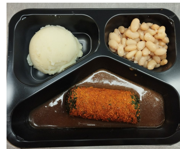
Exemple de menu

Possibilité de bénéficier d'un tarif social après enquête sociale réalisée par le service social du CPAS d'Arlon